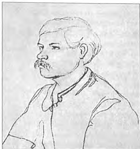
Портрет Григория Потанина