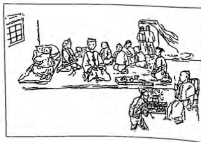
Курильщики опиума в Китае