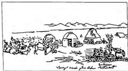
Лагерь на реке Или (Западный Китай)