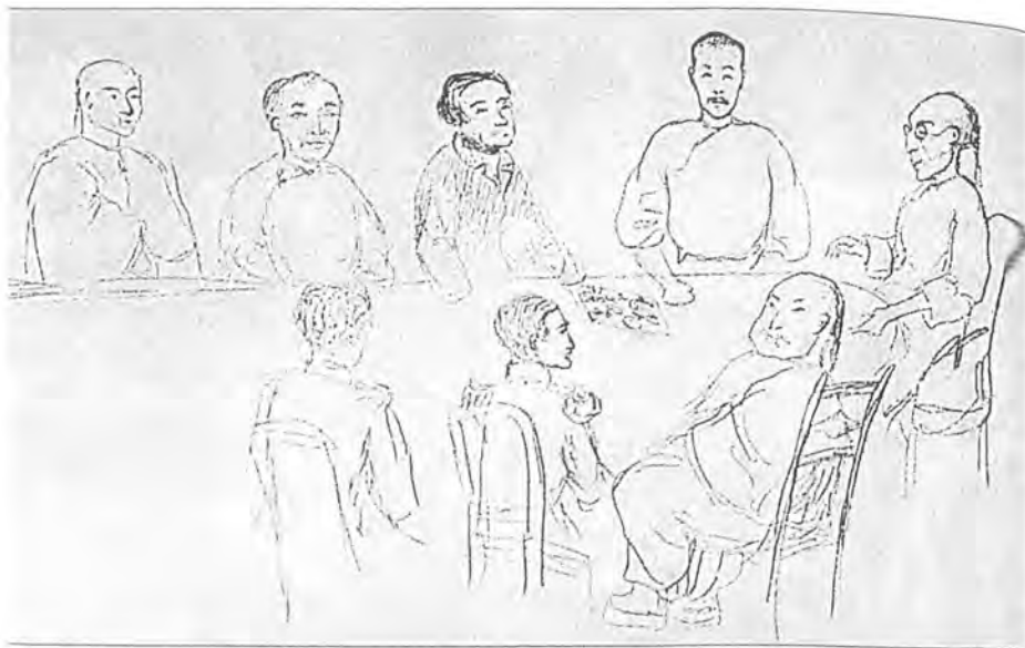
Прием у китайского сановника в Кульдже