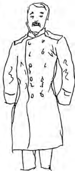
Е. П. Ковалевский. Рисунок Ч. Валиханова. 1860