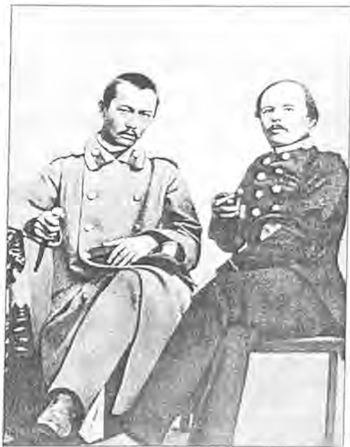
Ф. Достоевский и Ч. Валиханов. Семипалатинск (1856–1858). Фото

Весной 1856 года поручик Ч. Валиханов был откомандирован в распоряжение полковника М. М. Хоментовского, возглавлявшего экспедицию в северные районы Киргизии для приведения к присяге принявшего российское подданство рода бугу. Дневники, зарисовки, коллекции Ч. Валиханова представляют собой важный источник по истории и этнографии киргизского народа. Во время этой экспедиции Чокан впервые записывает отрывки из киргизской поэмы «Манас» и переводит их на русский язык. Он также записал и перевел народную легенду о трагической любви юноши Козы-Корпеша и прекрасной Баян-сулу — Ромео и Джульетты казахской степи. Результатом поездок в Семиречье и Киргизию стал ряд статей: «Географический очерк Заилийского края», «Предания и легенды Большой киргиз-кайсацкой орды», «Дневник поездок на Иссык-Куль» и др.