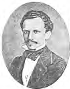
П. П. Семенов. 1850-е. Фото

Необходимость выработки правильной политической линии России в отношении происходивших в Кашгаре событий и исследовательские интересы русских ученых должны были способствовать успеху начинания. Уже ранние записи в путевом дневнике «На Иссык-Куль и в Кульджу» свидетельствуют, что Чокана все больше интересовал Кашгар, где Россия при заключении Кульджинского договора 13 предлагала учредить факторию, но получила отказ. На русские товары там хороший спрос, — свидетельствовали купцы. Чокан расспрашивал знаю-