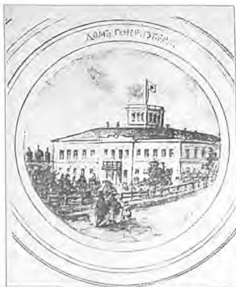
Дом генерал-губернатора в Омске. Акварель Ч. Валиханова. 1847