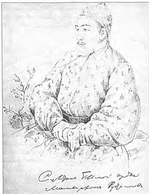
Султан Большой орды Мамырхан Рустемов