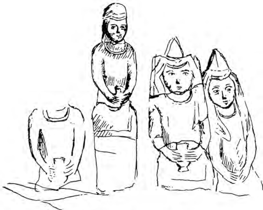
Каменные изваяния у гробницы Козы-Корпеша и Баян-сулу. Рисунок Ч. Валиханова

В конце лета 1856 года он в составе российской дипломатической миссии направляется в Кульджу для переговоров о возобновлении русско-китайской торговли. Трехмесячное пребывание в западных владениях цинского Китая 8 расширило круг научных интересов Ч. Валиханова и послужило подготовкой к его знаменитому путешествию в Восточный Туркестан. Статья «Западный край Китайской империи и город Кульджа» подытоживает результаты его поездки.