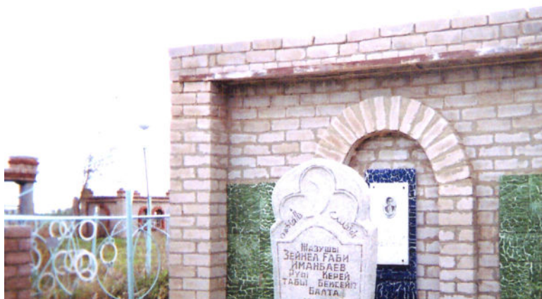
Ортақкөл ауылындағы жазушының зираты