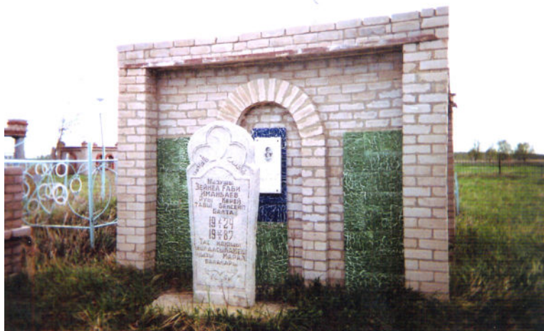
Ортақкөл ауылындағы жазушының зираты