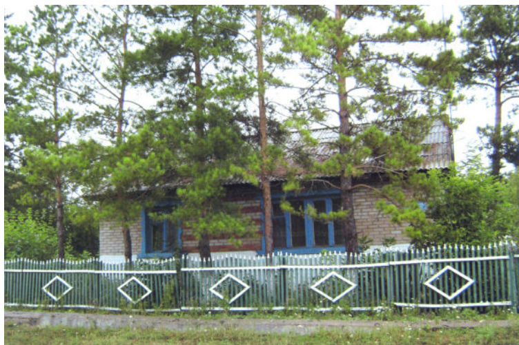
Повозочное ауылындағы үйі