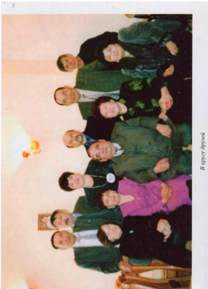
В кругу друзей