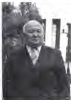
Иран Сал Тасқараұлы Тасқара (Ильяшев) - Абайдың туған ағасы, кенші - инженер, ақын, әнші, композитор