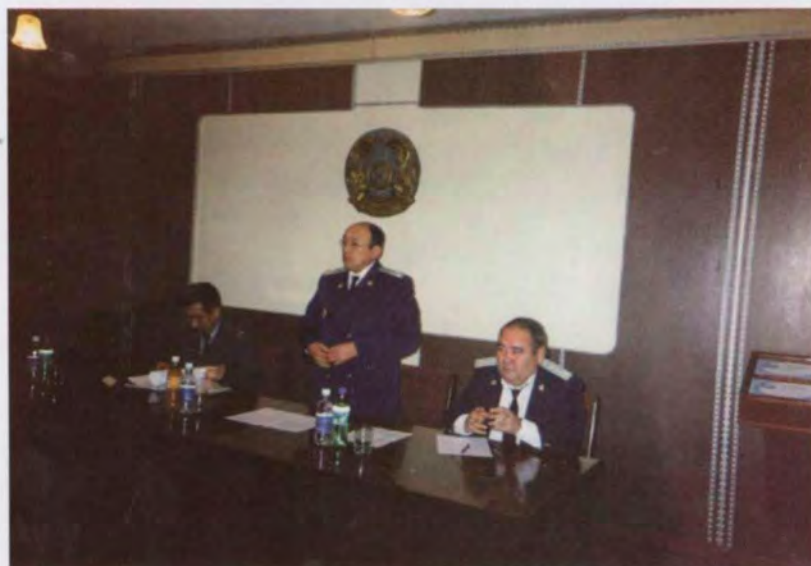
На совещании в Транспортной прокуратуре Акмолинской области, 2003 г.