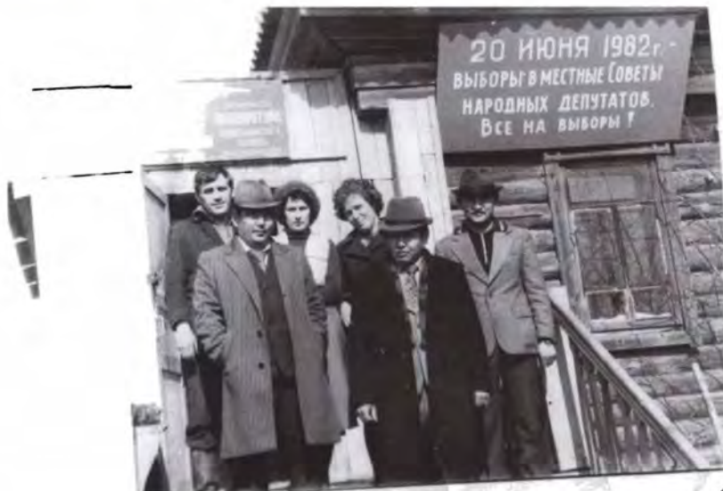
Коллектив прокуратуры Арык-Балыкского района Кокчетавской области, 1982 г.