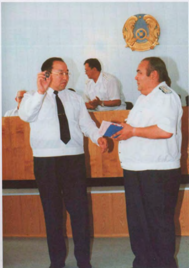
В честь празднования 78-ой годовщины органов прокуратуры в Республике Казахстан вручение награждения нагрудным знаком «Почетный работник прокуратуры Республики Казахстан», прокурором Акмолинской области Адильхан А.М., 2000 г.