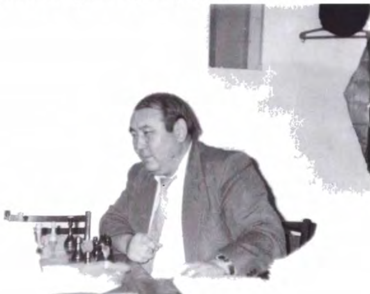
Участие в спортивных мероприятиях