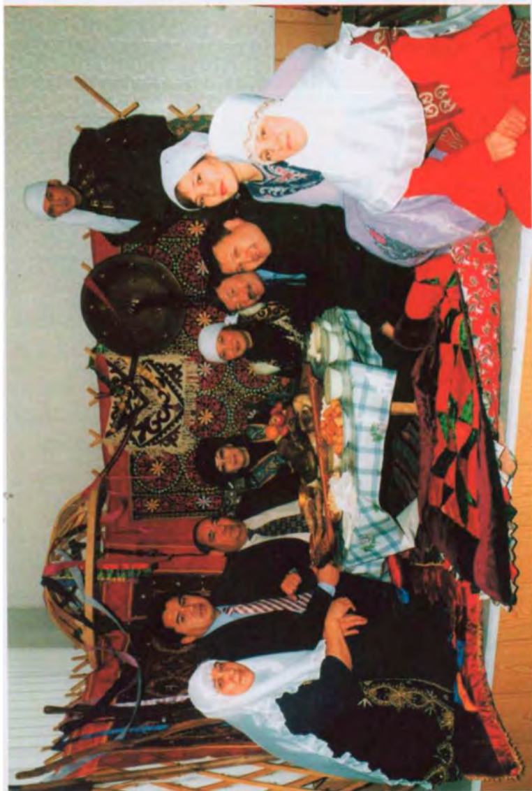
Празднование праздника Наурыз в Акмолинской областной прокуратуре, март 2004 г.