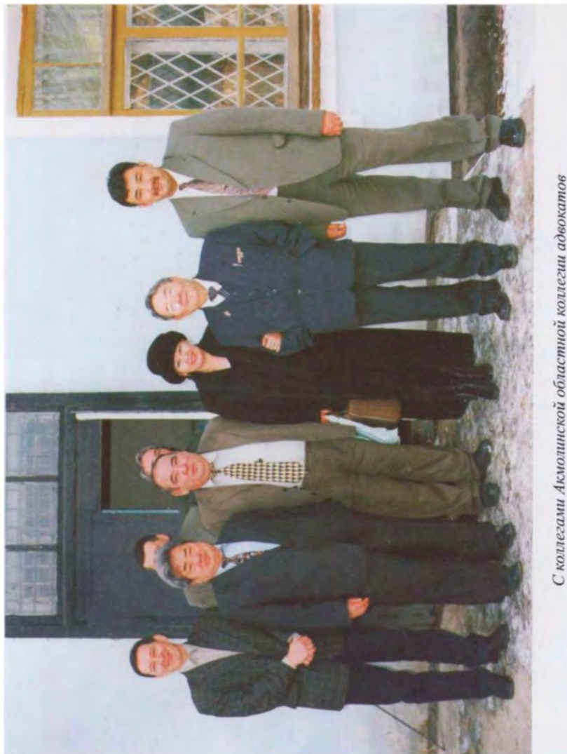
С коллегами Акмолинской областной коллегии адвокатов