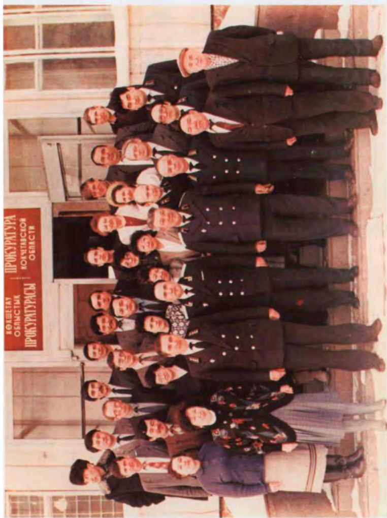
Коллектив прокуратуры Кокчетавской области, март 1991 г.