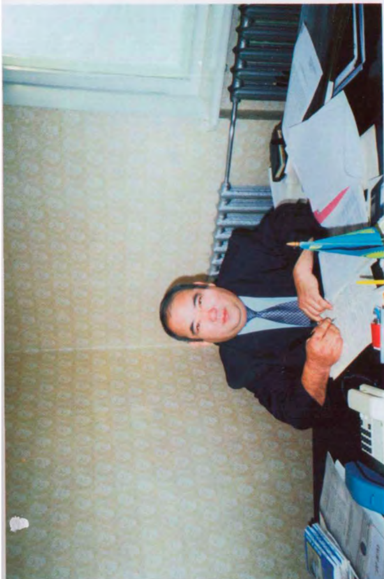
Начальник ЦПСИИ при прокуратуре Ақмолинской области – заместитель прокурора области, май 1999 г.