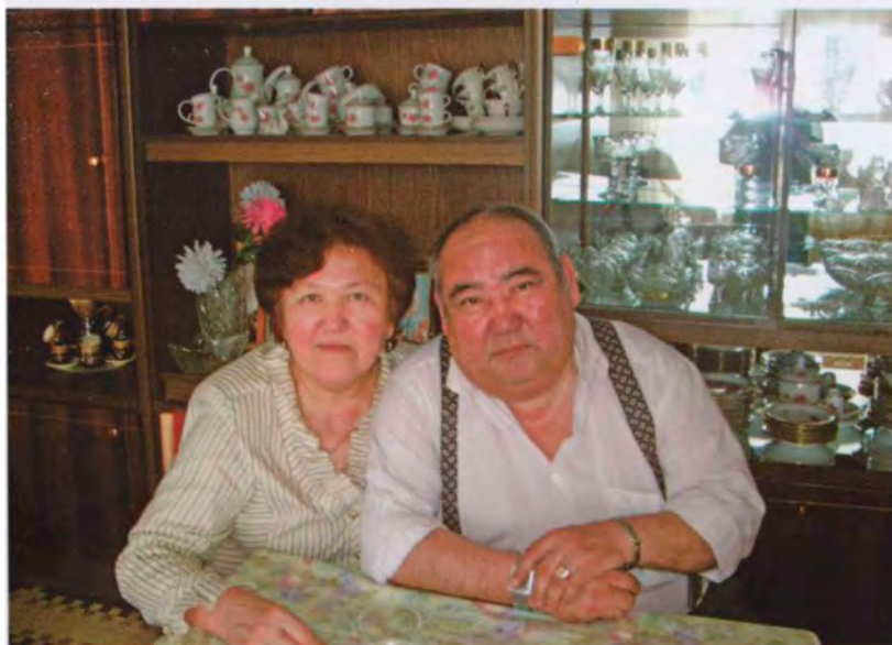
С супругой Сакып