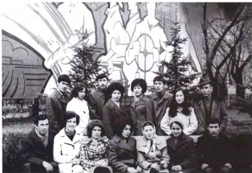
Студенческие годы, г. Алма-Ата