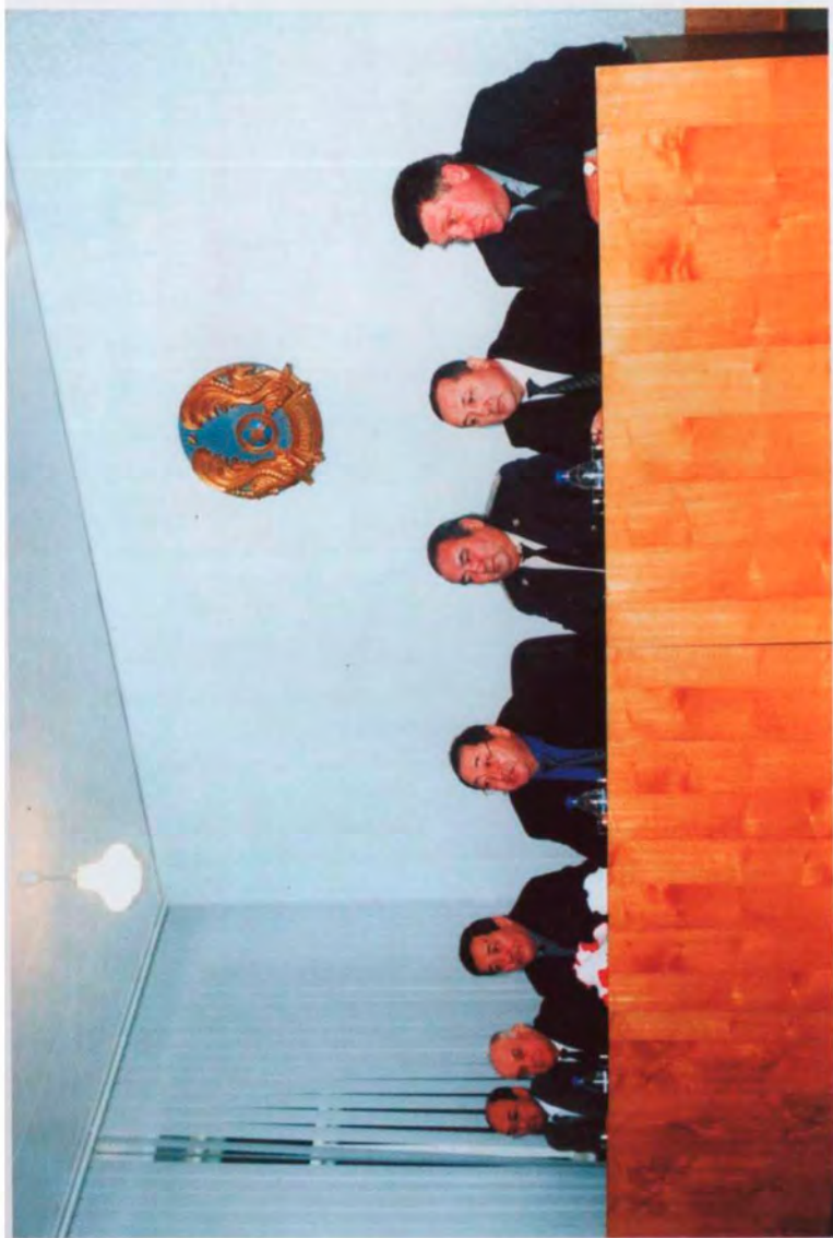
Заместитель прокурора Ақмолинской области, 1999-2001г.г.