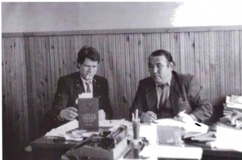
Годы следственной работы в органах прокуратуры, Кокчетавской области