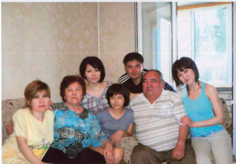
В кругу семьи