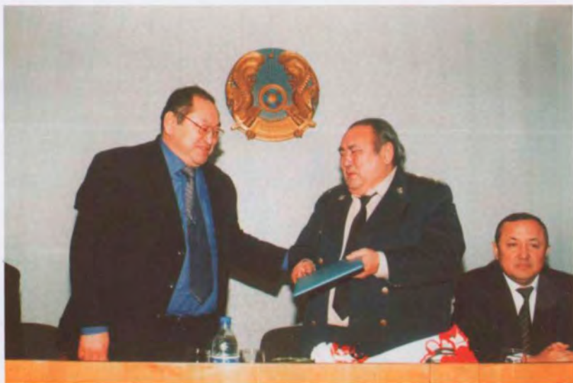
Поздравление в честь Дня рождения прокурором Акмолинской области Касымжановым С.К., 2002 г.