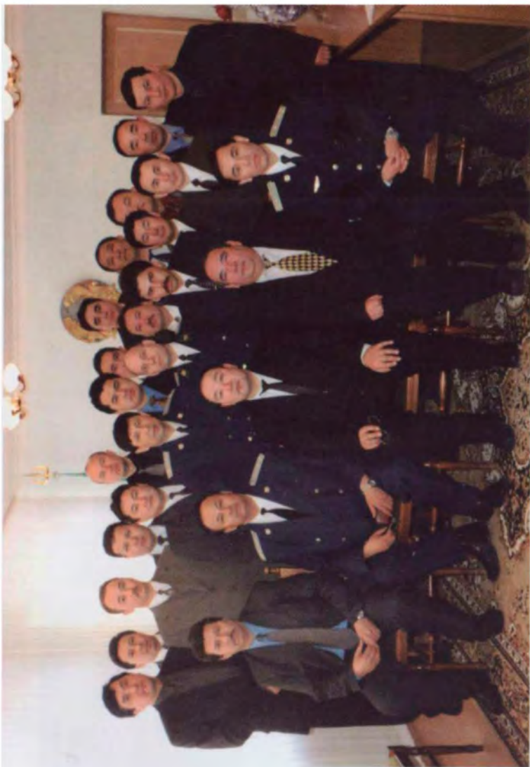
Коллектив прокуратуры Акмолинской области, 2000 г.