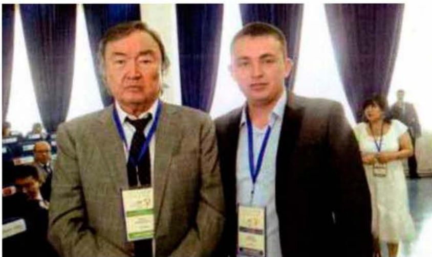
Н. Вербовский и всемирно известный поэт О. О. Сулейменов. Алматы, 2017 г.