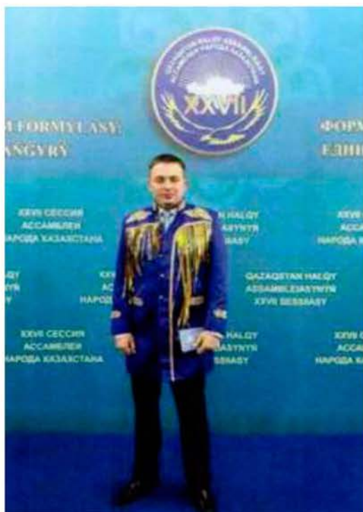
XXVII сессия Ассамблеи народа Казахстана под председательством Елбасы - Первого Президента страны Нурсултана Назарбаева и нынешнего Президента