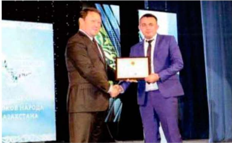
Благодарственное письмо «За большой личный вклад в развитие языков народов Казахстана» от акима Северо-Казахстанской области К. И. Аксакалова. г. Петропавловск, 2017 г.