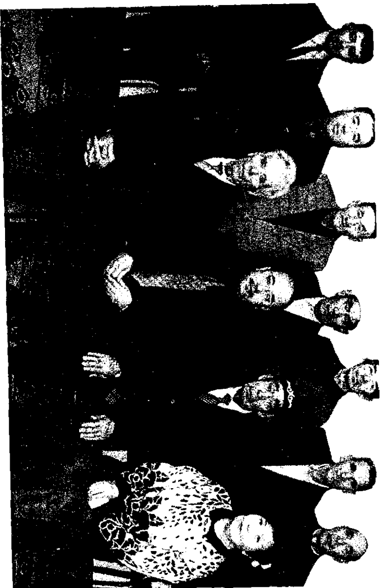
Астанаға туристік сапаға шығар алдында. 2004 жыл