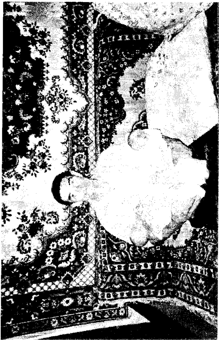
Қырғынан шыққан немерелер. 2002 жыл.