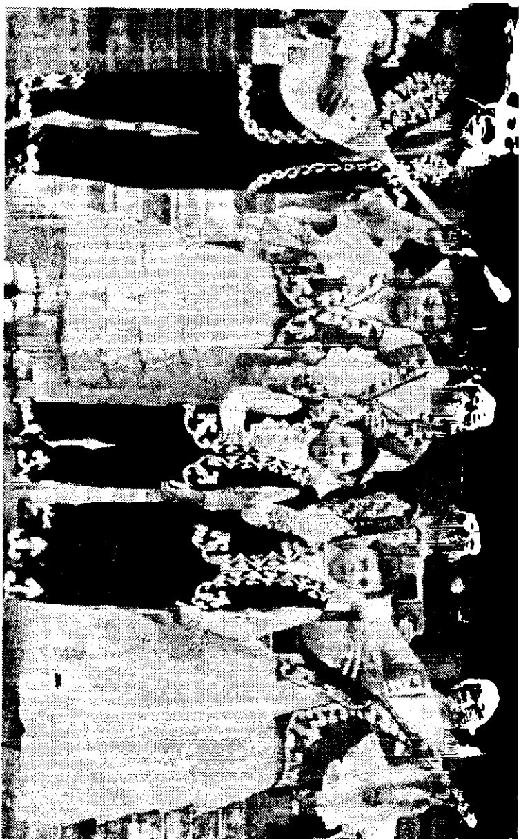
Хасеновтердін ансамбілі. 1989 жылы