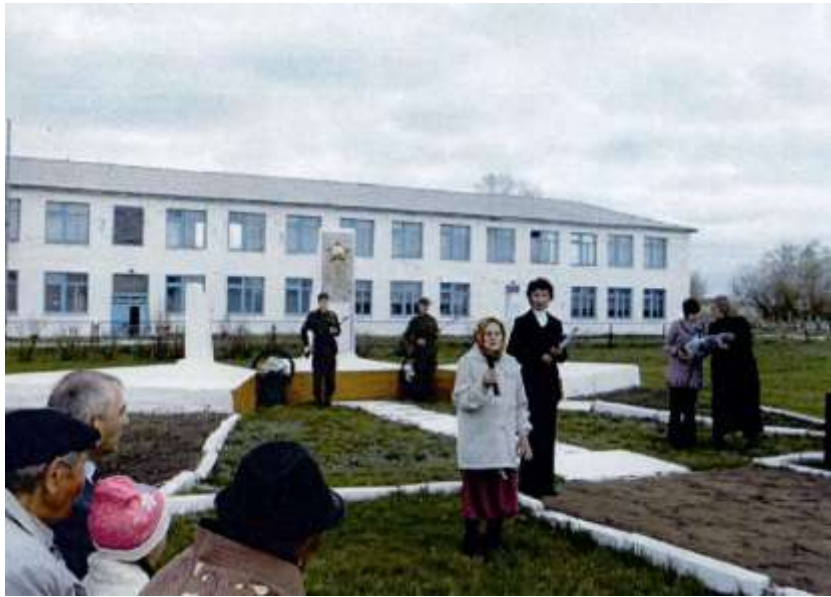
Выступает старейший житель села Лелюк А.Г.