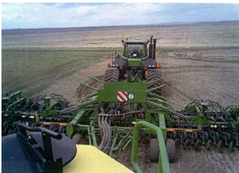
Новая техника на полях