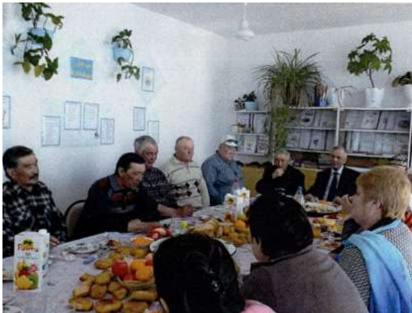
Посидим по- хорошему