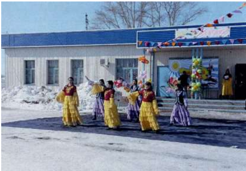
Праздник Наурыз мейрамы