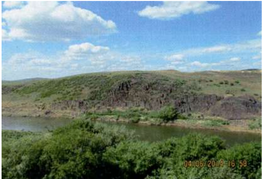
Ах эти милые просторы, Вода прозрачная до дна. Кругом полей, лесов узоры - Родная сердцу сторона.