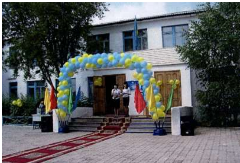
Школа встречает учеников 1 сентября