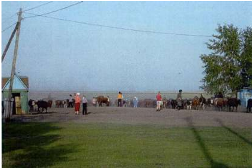
Ковалёвские встречают коров с пастбища