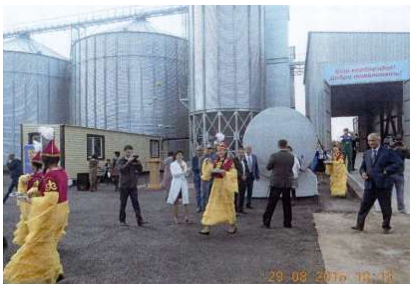
Открытие мини элеватора