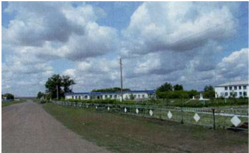
Любимый край что сердцу дорог