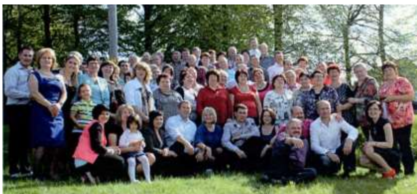
Ковьяне в Германии