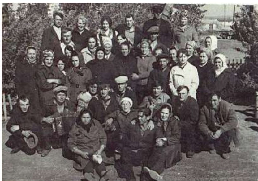
Как молоды мы были