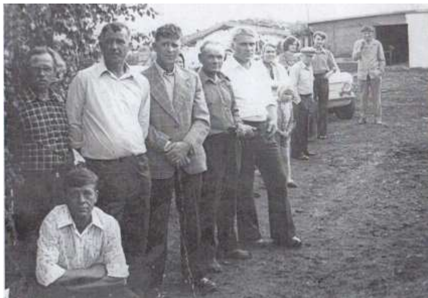
Есть такая древняя профессия - быть хлеборобом