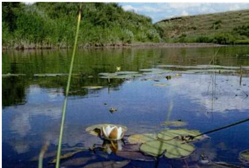
Найіа речка Акан-Бурлук