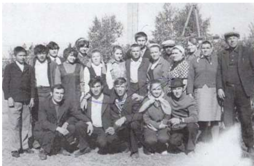
Люди разных профессий, низко вам поклониться хочу!!!