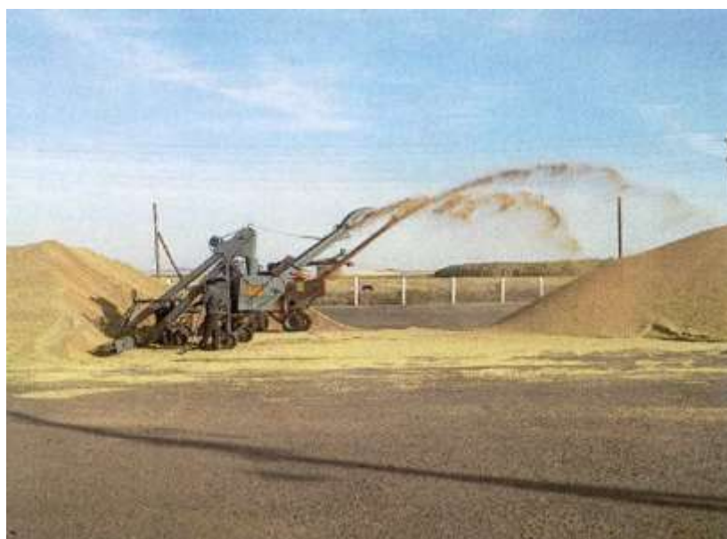
В полном разгаре страда деревенская