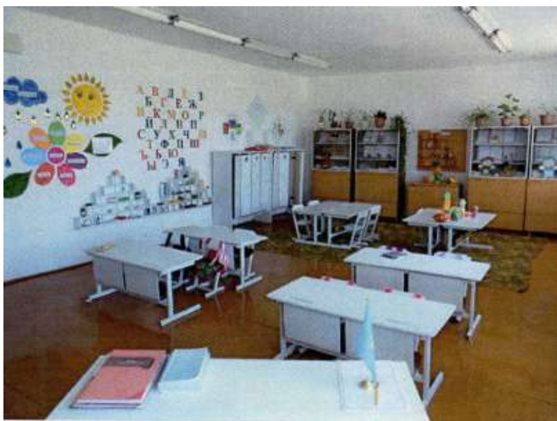
Мини сад для малышей