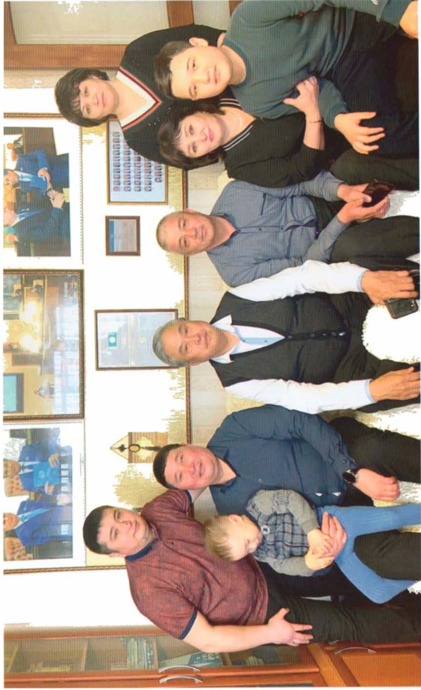
Айтжамал апасының ұл-қыздары мен жиендері құшағында