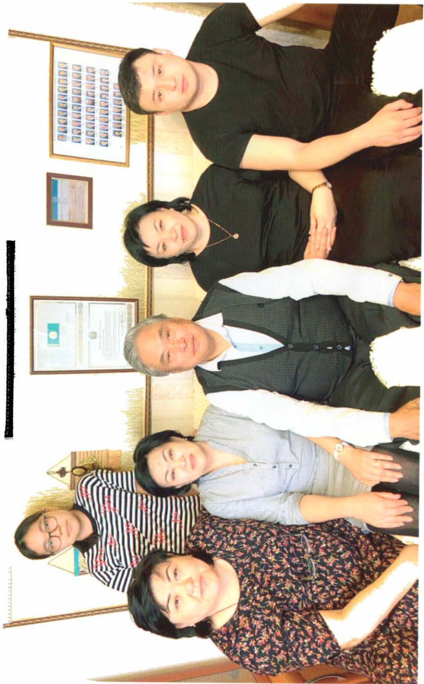
Қария апасының ұрлағы