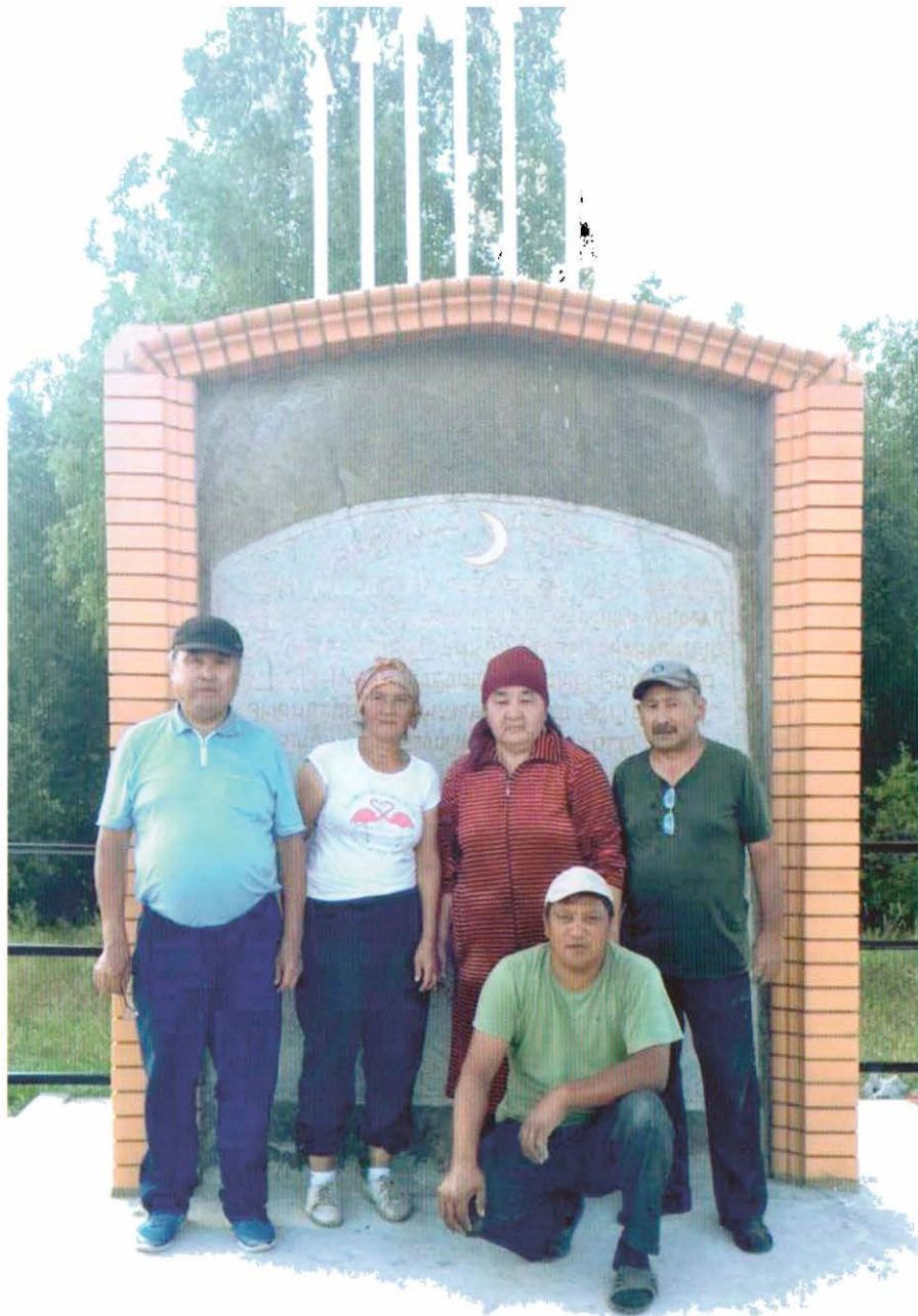
Киелі ата жұрт топырағы