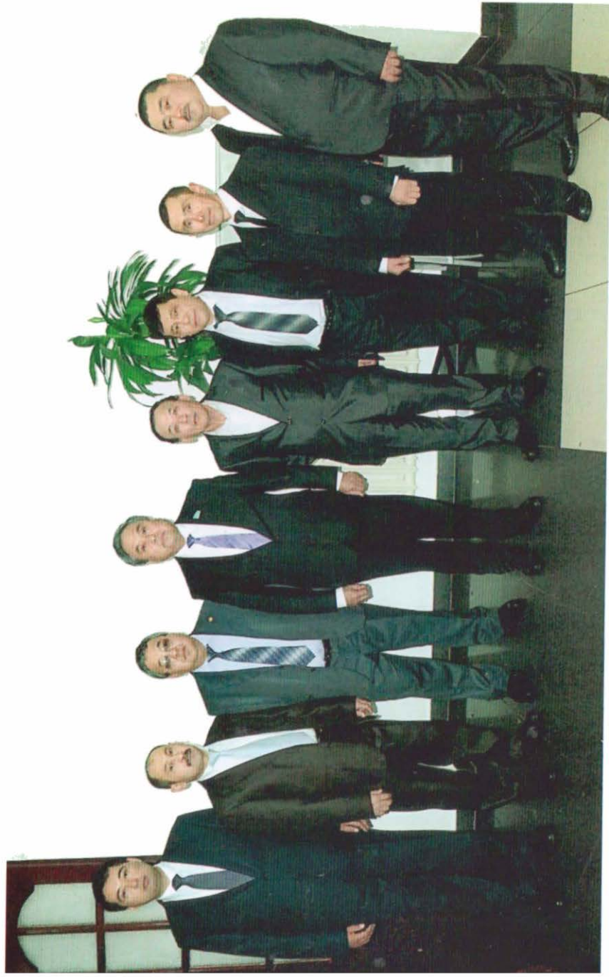
Ұлы Расул мен інілері ортаға алып...