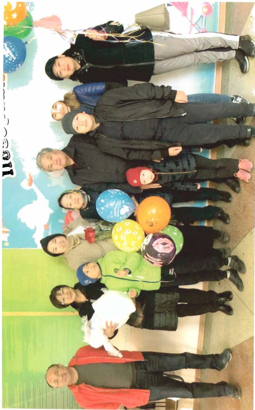
Сәби келді өмірге... Перзентхана алдындағы қуаныш