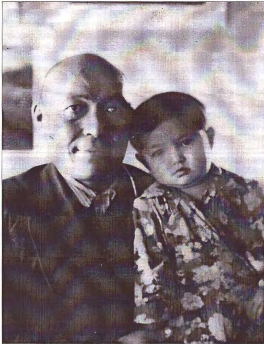
Мейрімді әке құшағындағы алаңсыз балалық шақ. Мен 3-жастамын.