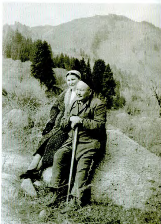
Медеуде. 1970 жыл.