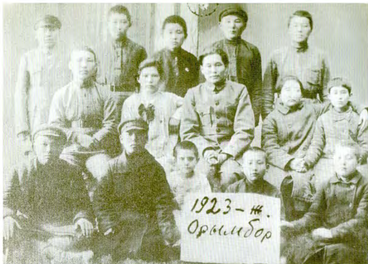
Орынбор қаласы. 1923 жыл.