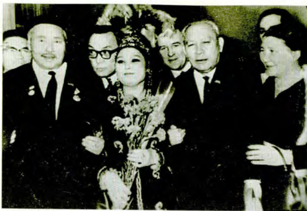
С. Мұқановтың 70 жылдық тойында. Мәскеу, 1970 жыл.