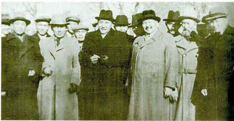
Ғабит Мүсірепов, Мұхтар Әуезов, Сәбит Мұқанов қаламгерлер арасында. 1956 жыл.