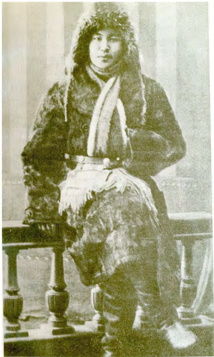
Сабит Мұқанов. 1923 жыл, Орынбор.