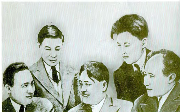
Солдан оңға қарай: І.Жансүгіров, Т.Жароков, С.Мұқанов, М.Қаратаев, М.Әуезов. Алматы, 1934 жыл.