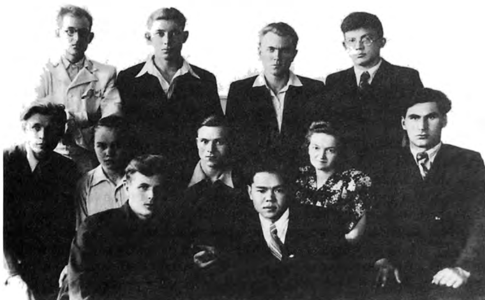
Томск қаласындағы институттағы жолдастары.