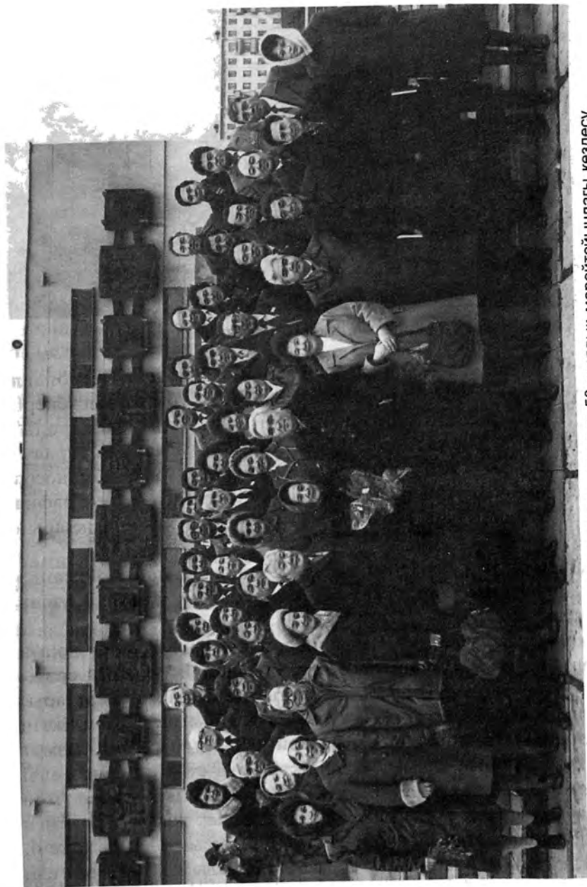
Петропавлдағы қазақ мектеп-интернатының 50-жылдық мерейтойындағы кездесу.