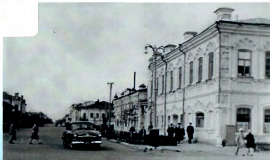
Улица Ленина, ныне улица Конституции Казахстана. Фото 1960 г.