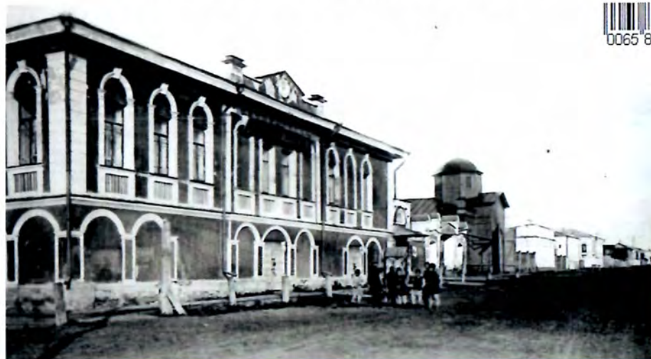
Улица Банковская, ныне улица Советская. Фото начала XX века