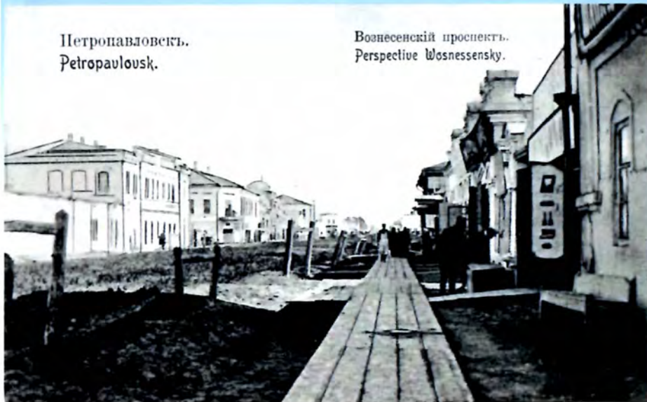
Вознесенский проспект. Perspective Vosnessensky.