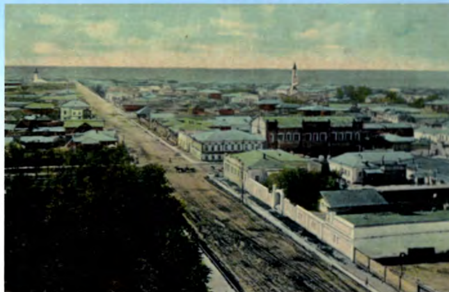
Улица Больше-Садовая, ныне улица Амангельды. Фото начала XX века