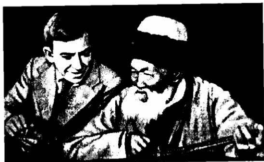
Слушая песню акына Джамбула.