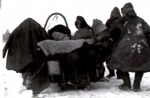
Исход казахов в 30-е годы XX в.