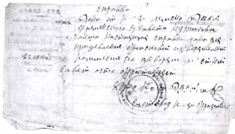
Справка с печатью и штампом колхоза ДвКА