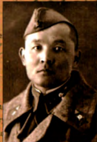
Пом. начальника 4 отдела