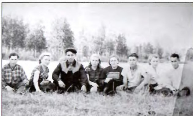
На колхозной стройке. Долгий Остров